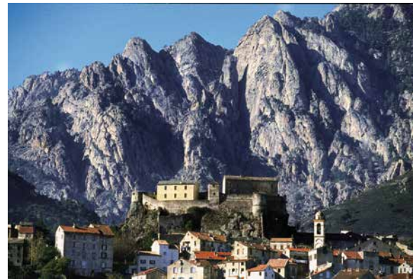
Citadelle de Corte

la grande barre rocheuse retenant le lac de Melo. Formant un cercle presque parfait, le Melo, d'où jaillit la Restonica, est un des sept lacs du mont Rotondo. Il est dominé par des escarpements de plus de 2000 mètres où subsistent, en été, quelques névés. Aleviné en truites et saumons de fontaine, ce lac est très apprécié des pêcheurs. Les plus courageux pourront poursuivre le sentier jusqu'au lac de Capitello, joyaux de la montagne insulaire. A une altitude de 1930 mètres, ce lac est gelé huit mois sur douze. Pour le lac de mélo comptez 2h30 AR et 1h30 AR supplémentaire pour le Capitello.