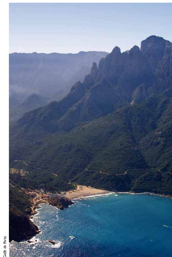
Golfe de Porto

est saisissant. Au nord la presqu'île de Girolata et la réserve naturelle de Scandola, au sud jusqu'au village de Piana (11 km de Porto) vous découvrirez les magnifiques calanques du même nom. Piques, colonnes, figures rongées par le vent et la mer, un lent travail d'érosion a donné à ces rochers déchiquetés des formes étranges et fantastiques.