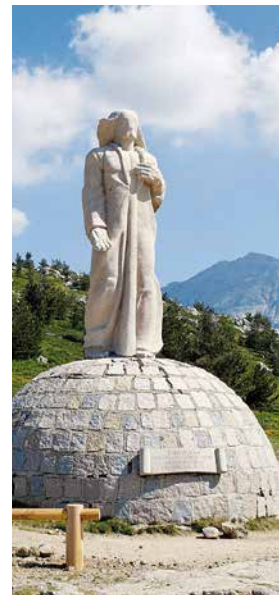
Statut monumentale en granit du Christ Roi édifié au col de Vergio. En arrière plan vue sur le Paglia-Orba.

Laricio laisse apparaître ça et là sa silhouette caractéristique : un tronc très élancé, plus cylindrique que vraiment conique avec sa parfaite rectitude, surmonté d'un houppier vert grisâtre, aux branches bien étagées. Doté d'une extraordinaire longévité, cet arbre emblématique et endémique de la Corse fait la fierté des insulaires. Prédéominant sur les pentes bien exposées, le pin Laricio cohabite parfois avec les sapins pectinés et les hêtres d'altitude sur les versants humides. Aujourd'hui, il occupe 45000 hectares dont près de 25000 en futaie pure. A proximité de la maison forestière de Poppaghia, 7km avant le col, s'élèvent les plus beaux pins Laricio de la forêt. Certains sujets hauts de 38m ont des troncs qui atteignent 5m de circonférence. Ils sont âgés de 500 ans.