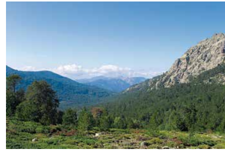
Le Niolo - Forêt de Valdu Niellu

Niellu, magnifique forêt dont parlaient déjà les Phéniciens: forêt-cathédrale où pins Laricio, hêtres et châtaigniers vivent en parfaite harmonie. Dès que l'arbousier, les chênes verts et pubescents se font rares, à partir de 800 mètres, le pin