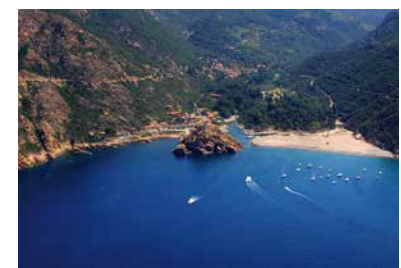
Rocher de Porto