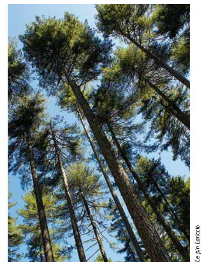
Le pin Laricio