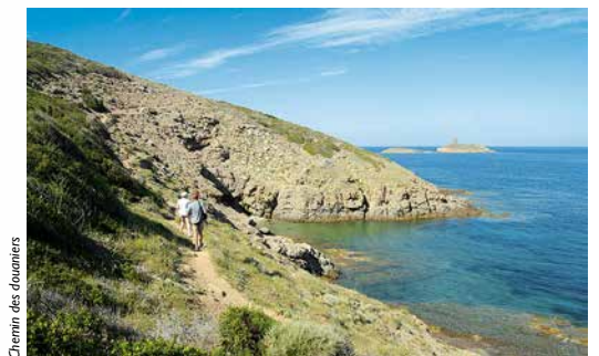
Chemin des douaniers

bord de mer vous grimpez progressivement sur une petite falaise; ce sera l'occasion d'une belle vue sur une enfilade de trois tours. Vous redescendrez ensuite aisément, toujours dans le même maquis odorant, vers la chapelle Santa Maria (XIème siècle) qui a donné son nom à une des tours. Cette dernière, d'une construction hardie, les pieds dans l'eau, confère un charme indéfinissable à l'endroit. En la contournant on s'apercevra qu'elle est entièrement fendue en deux: une belle coupe longitudinale, comme tracée exprès pour vous renseigner sur l'agencement intérieur d'une tour génoise. En continuant quelques minutes vous découvrirez une petite anse de sable: Cala Genovese où la mer est d'un bleu touristique. Le sentier des douaniers fait le tour de la pointe du Cap jusqu'à Centuri mais cette courte promenade vous en aura donné un magnifique aperçu.