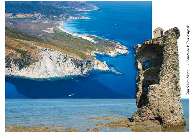
Tour Santa Maria - Pointe de la Tour d'Agrella