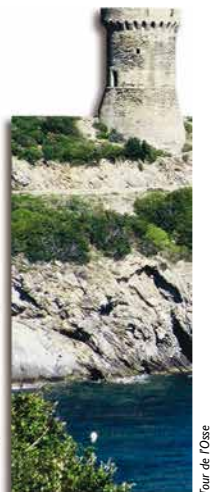
Tour de l'Osse