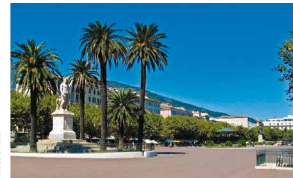
Place Saint Nicolas

tableaux de scènes religieuses. Figure emblématique de la ville de Bastia par sa situation privilégiée sur le vieux port, elle est classée monument historique depuis 1999. Devant sa magistrale façade baroque, rue St Jean, prenez les escaliers qui descendent sur le vieux port: Un charmant petit port de plaisance dans la vieille ville. Vous pourrez le longer jusqu'à la jetée du Dragon d'où vous aurez une vue d'ensemble depuis le phare sur les vieux immeubles de "Terra Vecchia" qui s'ordonnent en amphithéâtre autour de l'anse,