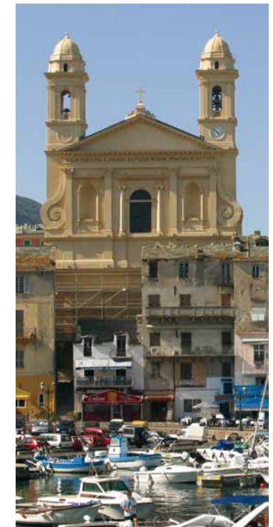
Eglise Saint Jean-Baptiste