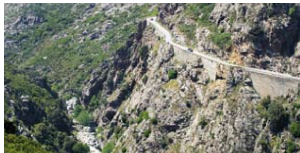
Défilé du Lancone

Au coeur d'un très beau golfe auquel il a donné son nom, St Florent est bâti sur une légère hauteur au nord de l'embouchure de l'Aliso. Très fréquentée, souvent appelée le "Saint-Tropez de la Corse", St Florent est une station balnéaire dont le succès se mesure facilement à la taille des yachts amarrés dans le port de plaisance. St Florent sert de point de départ vers les magnifiques plages encore sauvages qui s'étirent à flanc de maquis du désert des Agriates. Elle est la capitale du Nebbio, région qui se développe en amphithéâtre dans l'arrière pays. Le Nebbio est un pays de vignobles, d'olivaies, de vergers et de pâturages. Les paysages quadrillés de murets en pierres sèches et parsemés de bergeries, montre qu'il fût prospère, méritant son surnom de "conque d'or". Cette région compte de nombreux petits villages accueillants, posés en observatoires sur les hauteurs ceinturant le bassin de l'Aliso.