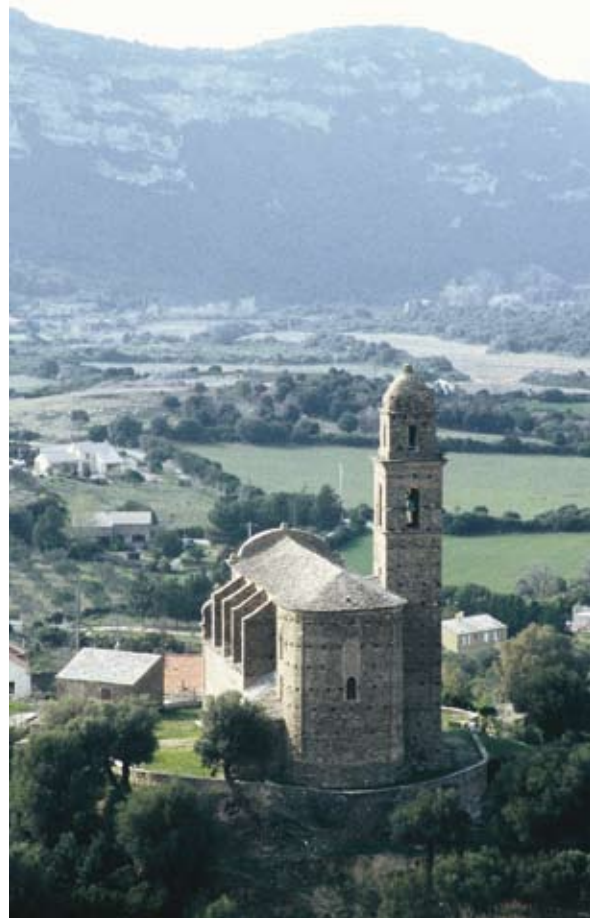
Eglise San Martino

De Patrimonio, la route monte par une série de larges lacets vers le col de Teghime qui offre un sublime panorama sur les deux côtes de l'île. Environ 3 kms après le col vous prendrez à droite la D264 qui vous permettra de contourner le centre de Bastia.