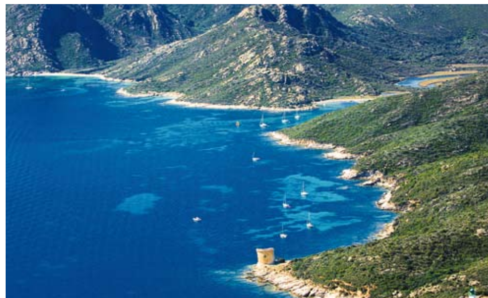
Tour de la Mortella