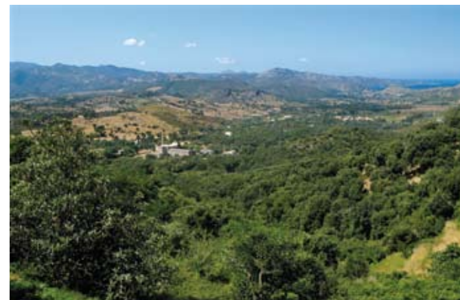
Plaine du Nebbio

vous serez alors sur la corniche du Nebbio en direction de Casta. Vous traverserez ainsi plusieurs petits villages: Rappale, Sorrio, Piève dont deux statues-menhirs du IIème millénaire avant J-C se dressent devant l'église, San Gavino et Santo Pietro di Tenda. A l'embranchement avec la D81 prendre à droite pour arriver à St Florent. Ville idéale pour la flânerie autour de sa marina. Du haut de sa citadelle, découvrez une vue surprenante de ses vieilles maisons bâties à fleur d'eau. A seulement 30 minutes du Camping San Damiano St Florent peut aussi être le lieu privilégié pour d'agréables soirées, à déguster une glace sur le port