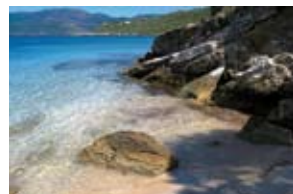
Plage de Loto