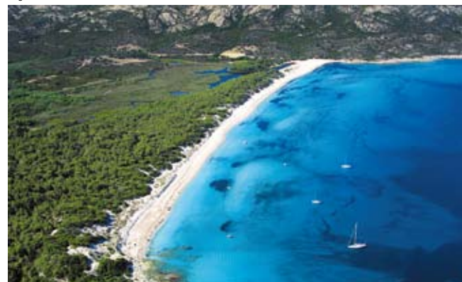
Plage de Saleccia

Le retour s'effectuera par le même itinéraire ou par les navettes en bateau (se renseigner des horaires et de la météo marine). D'ailleurs pour les allergiques à de longues marches, vous pouvez relier les plages de Loto et la non moins renommée plage de Saleccia par les navettes et ainsi profiter pleinement d'une plage magnifique où sable blanc et fin, eau transparente turquoise et fin, eau transparente turquoise évoquent un lagon agrémenté de maquis sauvage en arrière plan et quelques vaches en liberté pour l'originalité. Pas de doute, une des plus belles plages de méditerranée.