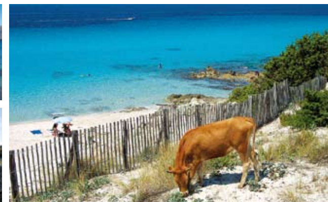
Plage de Saleccia